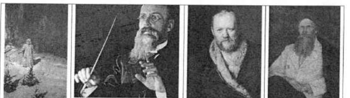
«онучкерега» Йскирим-овроксок сртовикоси виснеоав

Рассмотрите изображения и опишите их. Подумайте, что объединяет данные изображения? Обратите внимание на сюжет. Приведите примеры знакомых вам музыкальных героев из народных сказок, легенд, мифов и преданий